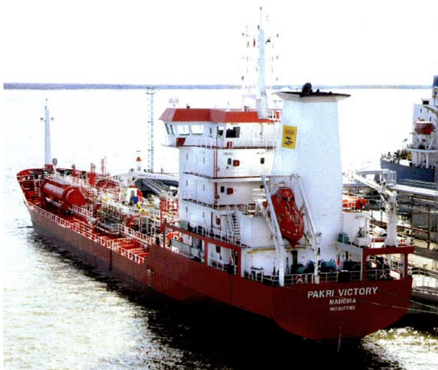
Pakri Victory går nu på timecharter hos estniska Pakri Tankers OÜ.